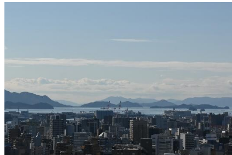
南側の客室からの眺め。 街なみ越しに瀬戸内の海が望めます。

地上約80メートルに位置しており、瀬戸内のやまなみやしまなみを望むことができます。さらに、東西の客室からはしまなみとともに広島駅に入線する新幹線や在来線を見ることができます。一日を通して表情を変える瀬戸内の景色を眺めながら、ワンランク上のホテルステイをお過ごしいただけます。