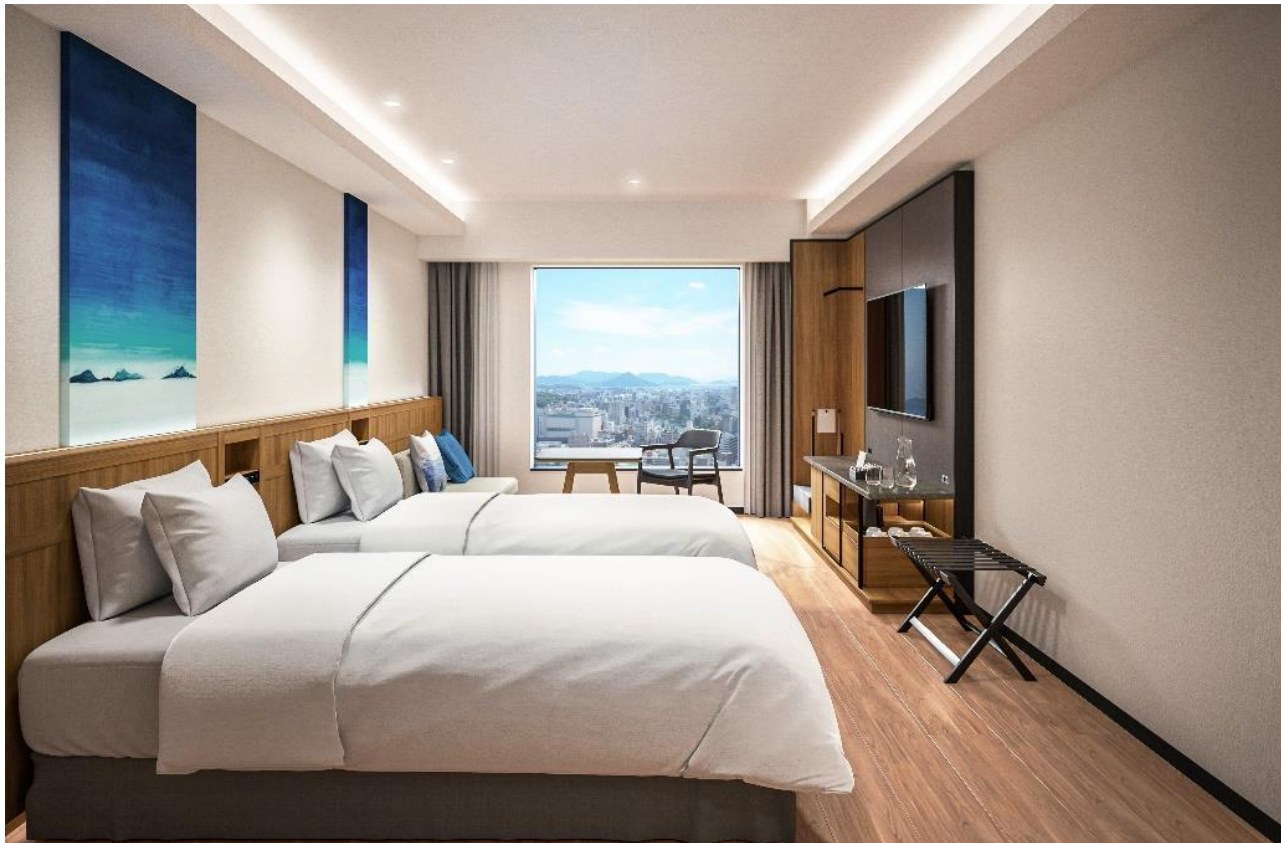
上層階・コンセプトフロアのツイン（30㎡）

このたび、2025年3月24日に開業を予定している新しい広島駅ビルの西側に出店するJR西日本ホテルズの新ホテル「ホテルグランヴィア広島サウスゲート」（以下「サウスゲート」）は、その上層階（20～21階）を「コンセプトフロア」として、広島街並みを一望する眺望とともに、「サウスゲート」のコンセプトである「瀬戸内の玄関口」を五感でお愉しみいただける、特別なひとときを提供いたします。