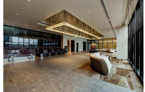
広島駅ビル7階に位置する アロマの香り漂うロビー

その仕掛けの一つとして、広島県産精油を使用したホテルオリジナルアロマを用いてロビーの香りを演出しています。客室には地元広島の職人が仕上げた上質なベッドや椅子、サステナブルな備前焼のマグカップなどを揃えることで、「椅子の座り心地がよく、仕事ははかどった」、「ロビーに漂うアロマの香りが癒された」、「客室の大きな窓から望む街並みや新幹線や在来線の列車を見れて最高」、「広島駅直上なので雨に濡れず移動できた」などの声をいただきました。