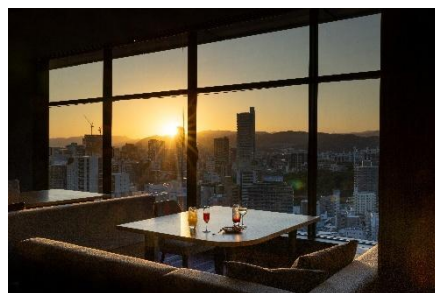
心安らく贅沢な時間をお楽しみいただく 「グランヴィアラウンジ」