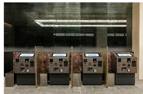
お客様ご自身のペースでお手続きいただける 自動チェックイン機

さらには利便性の先にある「人による温かいおもてなし」についても評価されており、当館ではロビースタッフが常にゲストに目を配り、先回りのサポートやカウンターでの丁寧な対応を徹底しています。「笑顔で寄り添って案内してくれた」、「グランヴィアならではの安心感がある」といった、接客について多くの高評価をいただいております。テクノロジーの快適性とホスピタリティの融合が、今回の受賞に繋がったと自負しております。