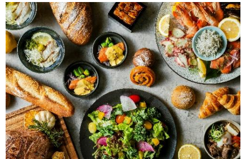
瀬戸内の豊かな海や島々の恵みを楽しむ Café & Buffet「UmiShima Dining」朝食

お客様からは、「口コミを見て朝食付きにして大正解だった。このホテルに泊まるなら、絶対に朝食を付けるべきだと友人にもおすすしたい」、「この朝食を食べるために、また広島に来る際はここに宿泊したい」といったお声が寄せられ、一日の始まりを贅沢に彩る特別な朝食は高評価をいただいています。