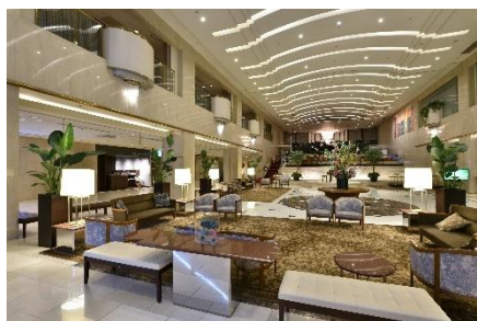
JR 広島駅直結という抜群の立地を活かした開放的なロビー空間

日ごろから、お客様から頂戴した口コミを共有し、おもてなし精神の磨き上げを実践している成果が、今回晴れて実を結びました。